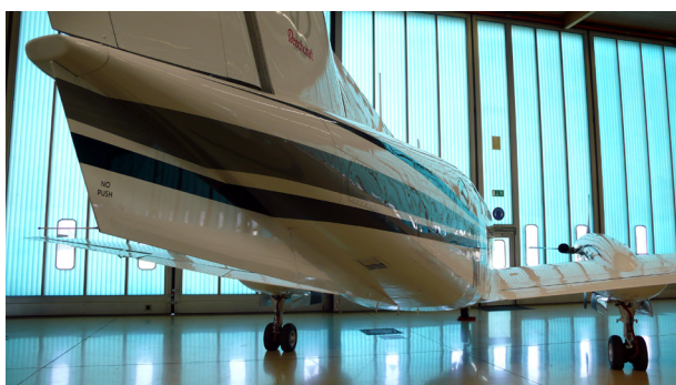
King Air mit Original Einzelfinne ab Werk vor der Raisbeck-Modifikation bei Beechcraft Augsburg

Das EPIC-Paket der C90 enthält außerdem ein 181kg höheres Abfluggewicht (= Increased Gross Weight 400 lb). Dies bedeutet mehr Reichweite oder bis zu zwei Passagiere mehr auf Langstrecken.