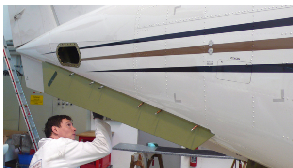
Erfahrene Spengler von Beechcraft Augsburg bringen die unlackierte Doppelfinne an. Später wird sie lackiert.