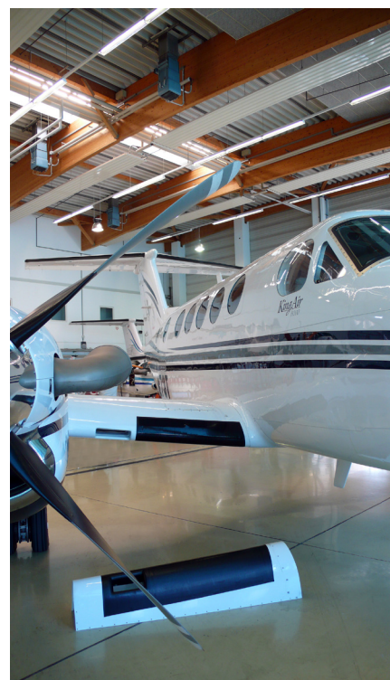
Original Edges an der King Air - unten zum Vergleich die wesentlich längeren Raisbeck Leading Edges

Mehr Info zu unseren Raisbeck-Upgrades unter: www.beechcraft.de/Raisbeck-EPIC-Kits.174.0.html