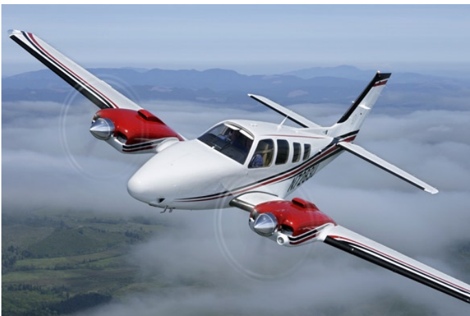
Die Beechcraft Baron G58 - nun EASA zugelassen

Fünf Jahre Garantie auf Zelle und alle Hawker-Beechcraft Teile sowie 3 Jahre oder 1000 Stunden für die Continental Motoren runden das Angebot ab.